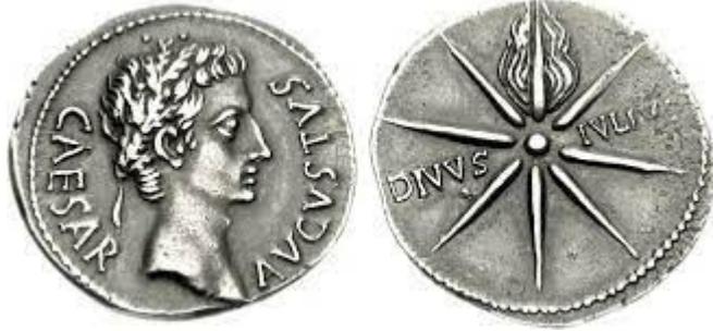
Illustration 1: Roman Denarius, 19-18 B.C.

พี่น้องทั้งหลาย ด้วยเหตุนี้โดยเห็นแก่ความเมตตากรุณาของพระเจ้า ข้าพเจ้าจึงวิงวอนท่านทั้งหลายให้ถวายตัวของท่านแด่พระองค์ เพื่อเป็นเครื่องบูชาที่มีชีวิต อันบริสุทธิ์ และเป็นที่ยอมรับของพระเจ้า ซึ่งเป็นการปรนนิบัติอันสมควรของท่านทั้งหลาย (โรม 12:1)